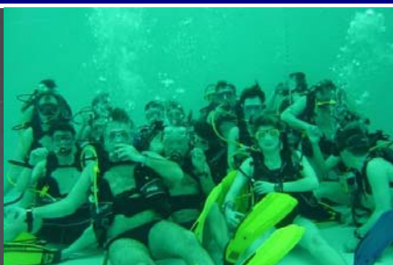
A gauche : dans le fût de 35 m. Ci-dessus, presque tout le groupe