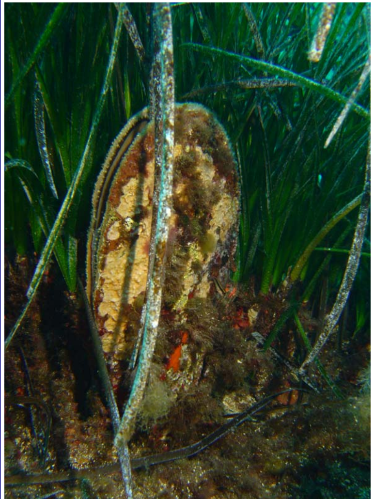
Une Grande Nacre