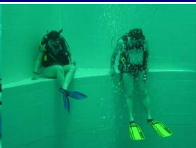
« J'y vais ou j'y vais pas ?!! »