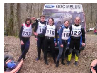
Les participants, en tenue